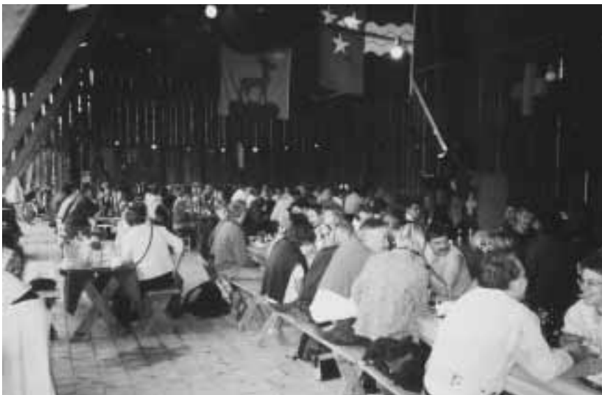
Im Unterstand von Viktor Schwaller war's ganz gemütlich!