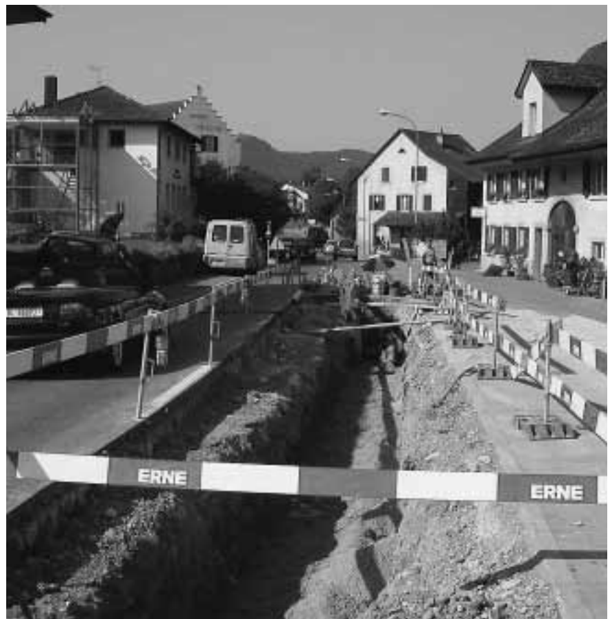
Die Baustelle für den Erdgasleitungsbau im Juli 2006