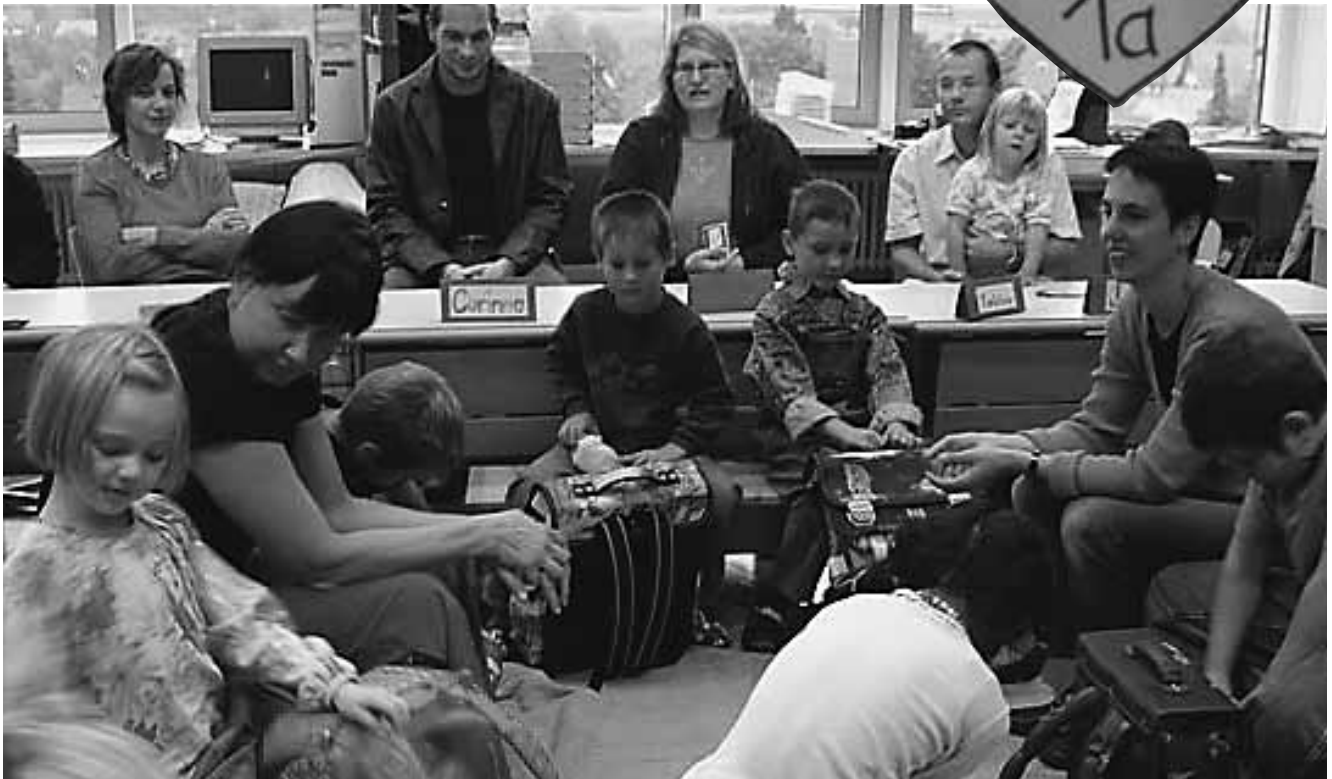
Ein herzlicher Empfang am ersten Schultag für Kinder und Eltern.