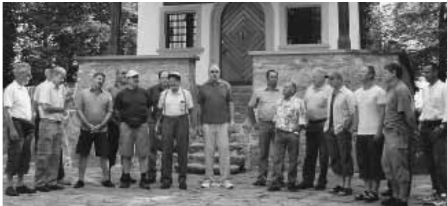
Da lässt es sich gut singen!