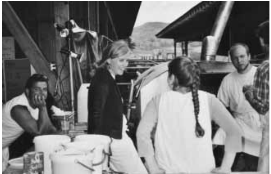
Das Jugendteam Freaktal versorgte die Anwesenden mit Pizzas, Getränken und Wurstwaren.