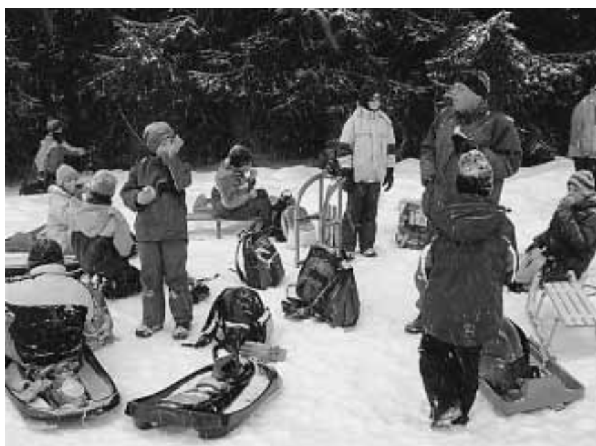
Gerne war er mit Schülerinnen und Schülern unterwegs.