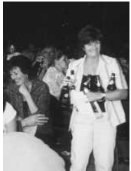
Wohl nicht alles selbst getrunken?