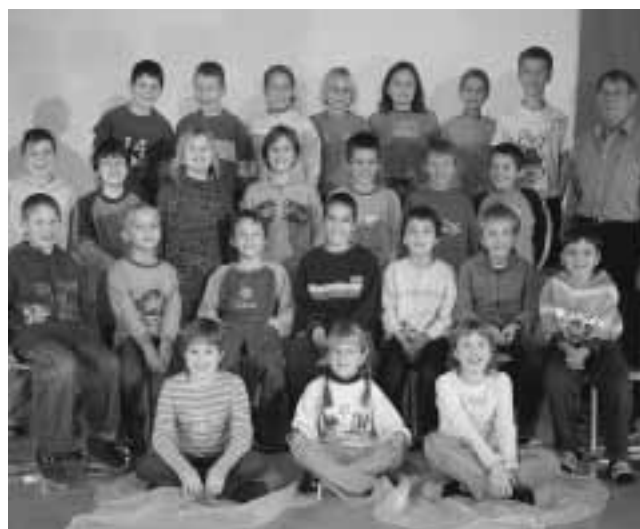
Letzte Klassenfoto 2006: 3. Klasse A, Jahrgang 1996