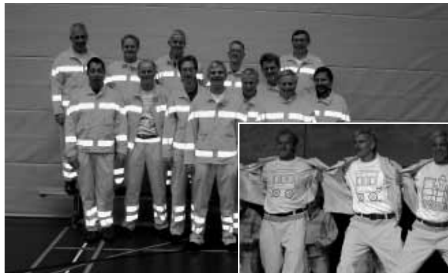
Gruppenbild der Männerturner an der gelungenen Turner-Show 2007