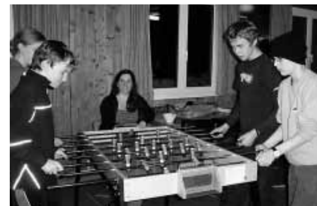
Spielturnier am Sonntagabend