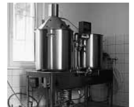
Brauanlage «Metzler» Sudpfanne mit Läuterbottich

freuen sich auf die Eröffnung, die ca. Ende Mai stattfinden wird. Übrigens können noch die letzten 30 Obligationen gezeichnet werden. Das genaue Eröffnungsdatum werden wir via Medien oder unter www.tiersteiner.ch bekannt geben.