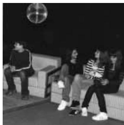
Bequeme Sofas zum Plaudern