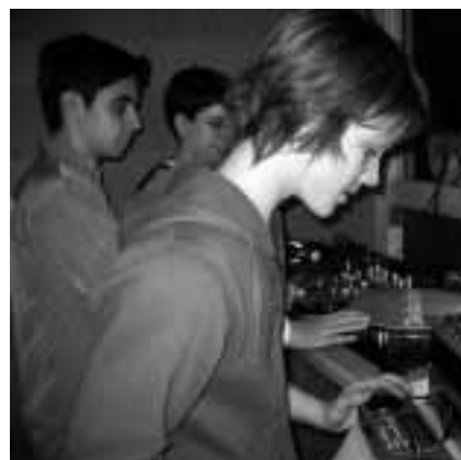
DJs sorgen für heisse Musik