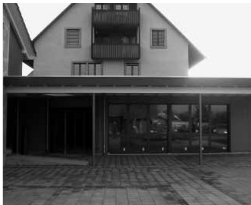
Eingangspartie des erweiterten Volg-Centers; Erschlossen von der Parkplatzseite her.

Informationsbroschüre «Sicher Rad fahren» http://shop.bfu.ch/pdf/78_42.pdf Informationsbroschüre «Fahrradausrüstung für kluge Köpfe» http://shop.bfu.ch/pdf/92_42.pdf Merkblatt «Mountainbike» http://shop.bfu.ch/pdf/128_43.pdf Website der Velohelmkampagne: www.velohelm.ch