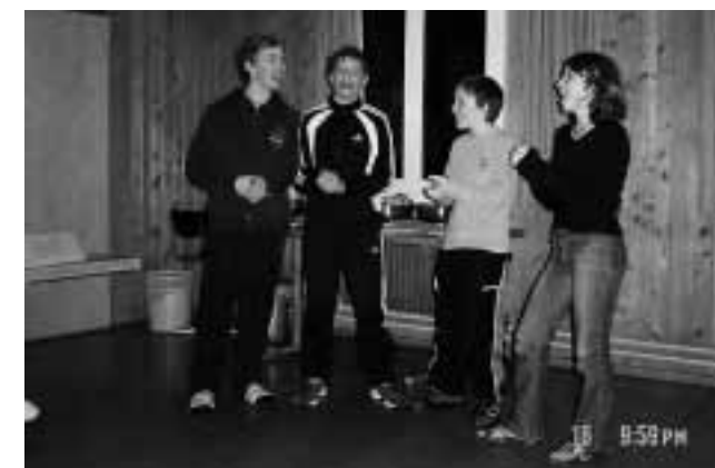
Die Skifahrer neben der Piste in Andiast. Unterhaltung muss sein!