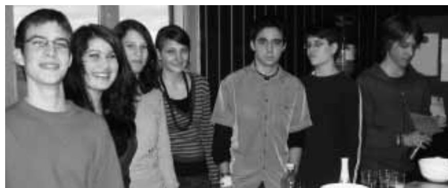
Die Betriebsgruppe serviert nur alkoholfreie Getränke