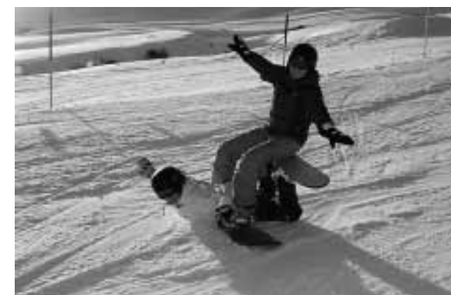
Auch so gehts abwärts! Der «Schneesport-Flieger!»