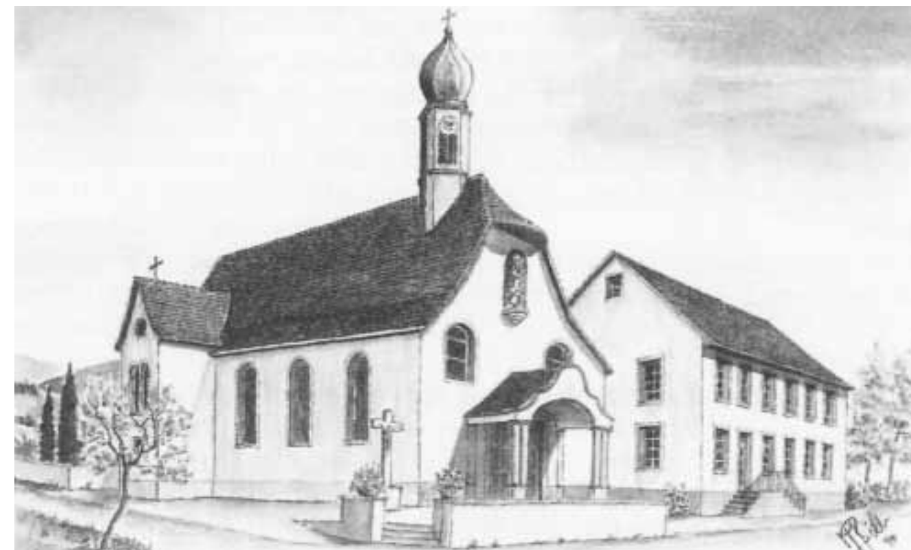
Kapelle und Gemeindehaus 1961

Fehler sind immer schwer zu beweisen. Sie hängen trotz allem an ihrer Heimat. Mehr Sippenpolitik als Parteipolitik, was sie lieben. Sie sind dem Modern gar nicht abgeneigt, wiewohl sie am Alten hängen. Noch zählt das Dorf 67 Pferde, aber jeder Bauer hat 2-3 Motormaschinen. Auch Melkmaschinen haben Eingang gefunden. Eine Waschmaschine gehört heute ins Haus. Der Radio darf nicht fehlen. Fernsehapparate sind wenige da. Fast möchte man sagen, sie wagen es nicht. Oder ist es der Gedanke, dass davon das Heil nicht abhängt?