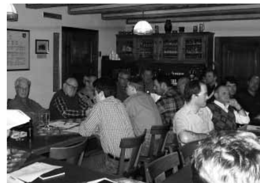
Bild von der Versammlungsrunde