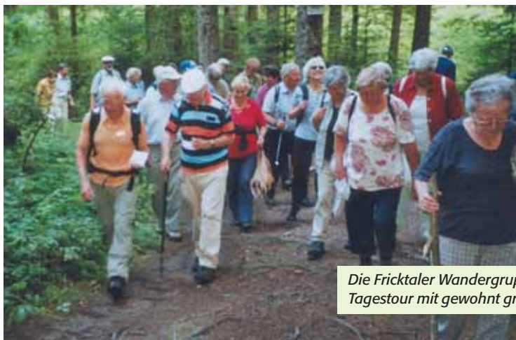
Die Fricktaler Wandergruppe auf einer Tagestour mit gewohnt grosser Beteiligung