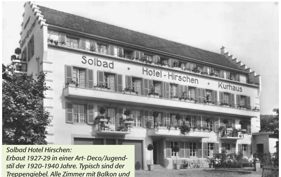
Solbad Hotel Hirschen: Erbaut 1927-29 in einer Art- Deco/Jugendstil der 1920-1940 Jahre. Typisch sind der Treppengiebel. Alle Zimmer mit Balkon und mit Blumen geschmückt.

Ein Schwimmbad war 1932 im oberen Fricktal ein Novum. Man begegnete ihm mit einigem Misstrauen. Hin und wieder war die Anlage aber dennoch gesellschaftlicher Treffpunkt. So wurde z. B. der 1. August 1934 in der Schwimmbadanlage ge-