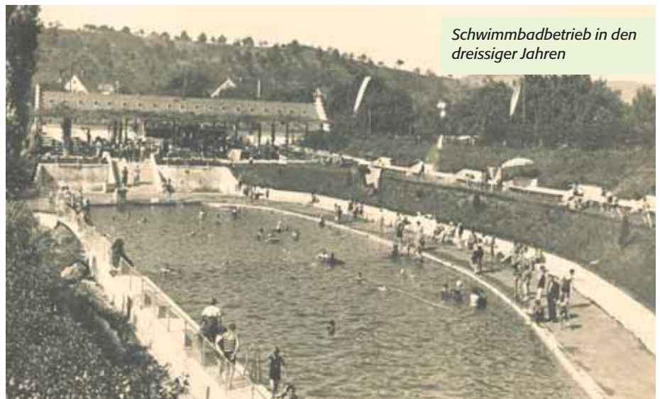
Schwimmbadbetrieb in den dreissiger Jahren