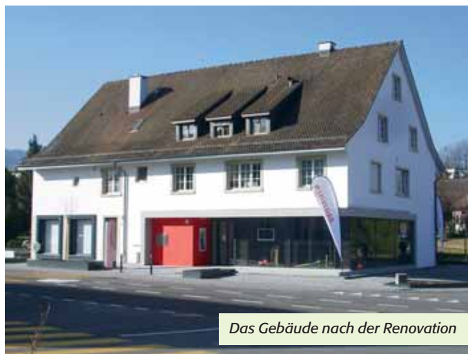
Das Gebäude nach der Renovation