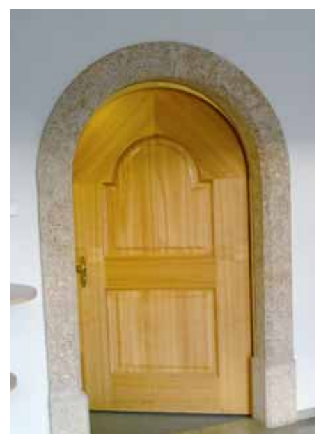
Türgewänd im Schalterbereich der Bank 1979–2008 mit Türe aus Oberfricker-Kirschaumholz