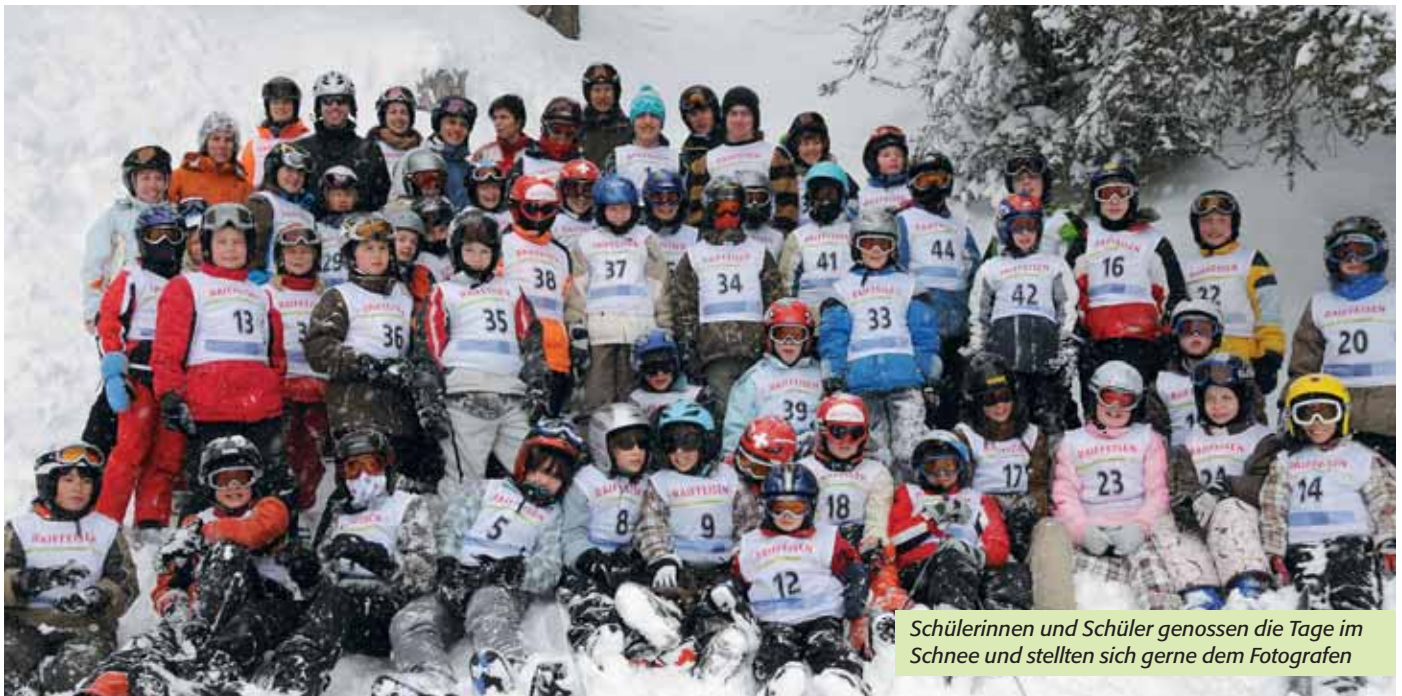
Schülerinnen und Schüler genossen die Tage im Schnee und stellten sich gerne dem Fotografen

Wir danken unseren Sponsoren Raiffeisenbank Regio Frick, Pastinella Unterentfelden, Landi Gipf-Oberfrick, Coop und Migros Frick sowie verschiedenen Familien aus Gipf-Oberfrick für die Unterstützung ganz herzlich.