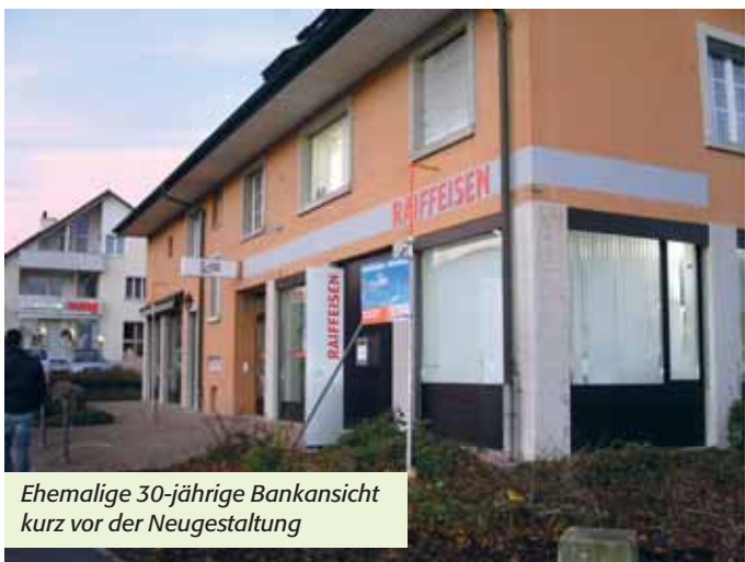
Ehemalige 30-jährige Bankansicht kurz vor der Neugestaltung