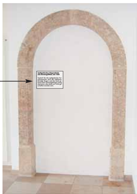
Türgewänd im Treppenhaus der Raiffeisenbank ab 2008

Ein Schmuckstück im alten Bankgebäude bildete das Türgewände im Kundenraum, der Torbogen, den man aus dem Bauernhaus retten konnte. Jetzt ist er im Treppenhaus ausgestellt.