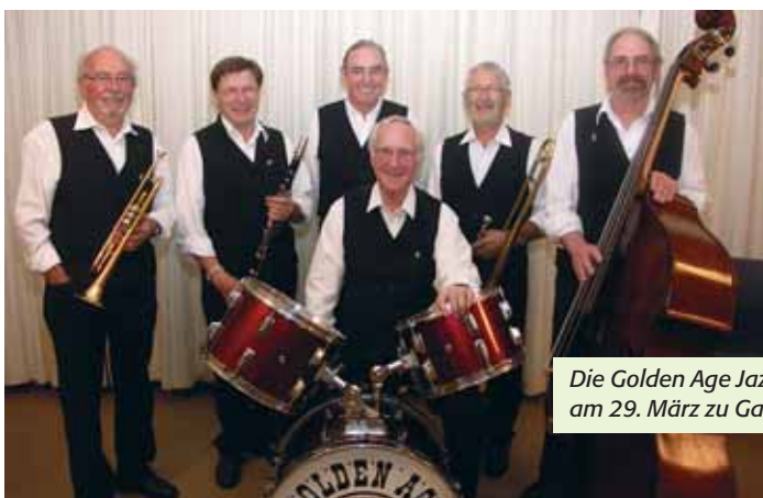
Die Golden Age Jazzband Bern am 29. März zu Gast in Gipf-Oberfrick

Nähere Informationen zur Jazzmatinee gibt es im demnächst erscheinenden KUL'TOUR-Flyer, in der Tagespresse und auf www.kul-tour.org .